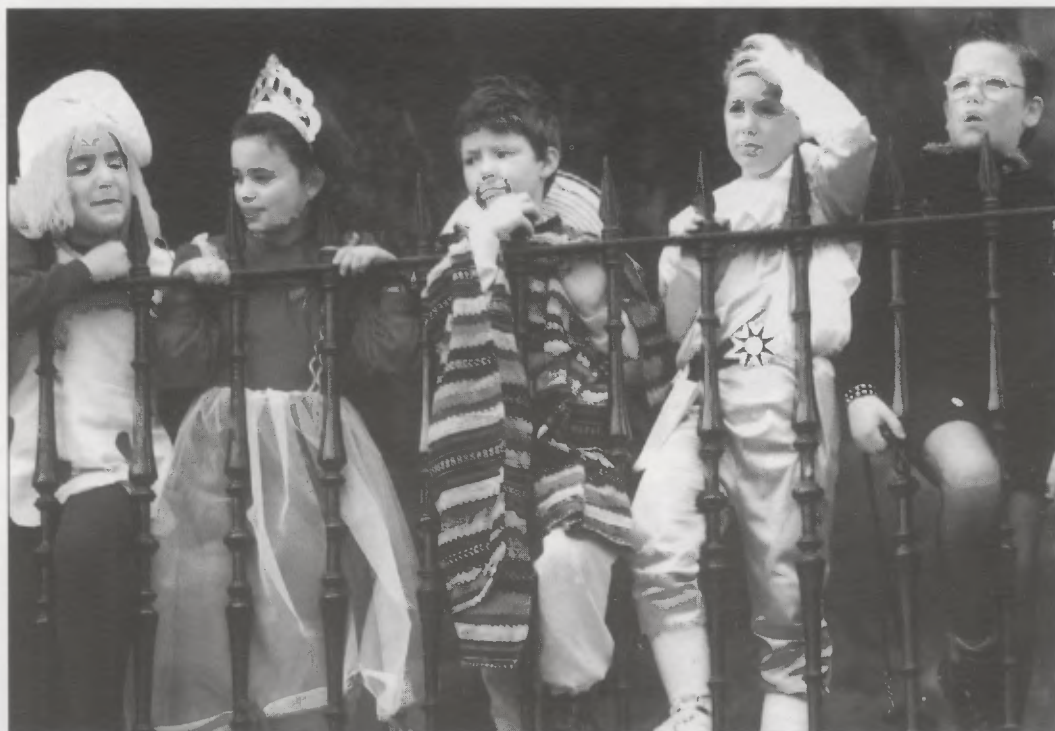
“Problemarik batere ez dago, printzipioz, etorkinak eta horien umeak euskaldun-euskaldunak izateko: arraza euskaldunekoak, mintzaira eta kultura euskaldunekoak, aberrigintza euskaldun baten eraikileak”.

tien definitzaile eta ez euskaldunen eskludizaile izan litezkeen horrelako ezaugarrien multzorik, aldamenetako herrien ezaugarri buruz-buru (txinoei edo beltzei buruz bai). Euskaldun denak ez dira, gaztelau batzuk ordea bai, odol grupo horretakoak, etab. Dagoena, hortakoz, arraza zuri haundi bat da. Eta gaztelauak, galegoak, euskaldunak, etab., herriak dira, alegia, arraza bakar hori historian zehar eta kulturalki zirkunstanzien arabera hartuz joan den herri-forma desberdinak: “Il n’y a pas de race basque - mais il y a un peuple basque formé historiquement” 4